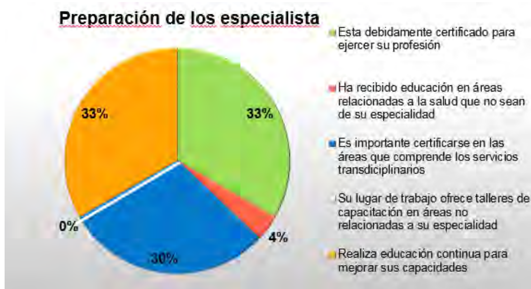
Figura 2. Encasillado B: Preparación de los especialistas

de un caso?, muy de acuerdo 0%, algo de acuerdo 11%, muy en desacuerdo 83% y algo en desacuerdo 6%.