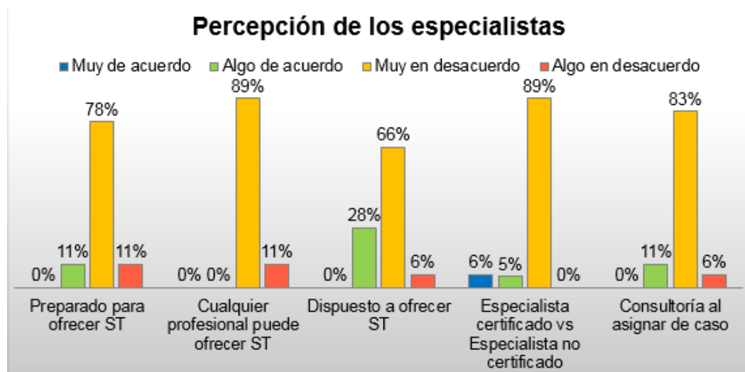
Figura 1. Encasillado A: Percepción de los especialistas

El Encasillado A constó de 5 preguntas dirigidas a al área de percepción. En la pregunta 1. ¿Está preparado el profesional de la salud para ofrecer servicios transdisciplinarios?, muy de acuerdo 0%, algo de acuerdo 11%, muy en desacuerdo 78% y algo en desacuerdo 11%. En la pregunta 2. ¿Entiende que cualquier profesional puede ofrecer servicios transdisciplinarios?, muy de acuerdo 0%, algo de acuerdo 0%, muy en desacuerdo 89% y algo en desacuerdo 11%. En la pregunta 3. ¿Cómo proveedor de servicios está dispuesto a brindar servicios fuera de su especialidad?, muy de acuerdo 0%, algo de acuerdo 28%, muy en desacuerdo 66% y algo en desacuerdo 6%. En la pregunta 4. ¿Son mejores las técnicas de un especialista vs las de otro especialista que conoce, pero no está debidamente certificado?, muy de acuerdo 6%, algo de acuerdo 5%, muy en desacuerdo 89% y algo en desacuerdo 0%. Para finalizar con el Encasillado A, en la pregunta 5. ¿Se le está brindando un proceso de consulta adecuado al momento de la asignación